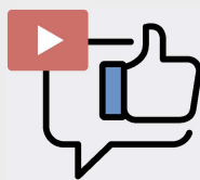
Retransmisión en tiempo real

Ya adelantábamos que el mundo mobile completará su inmersión en 2017, y esto sumado a la tecnología wearable hace que nuestra vida se simplifique . No solo serán los dispositivos móviles los encargados de “hacer” esta transformación (de hecho ya hemos vivido la irrupción de los smartwatches), sino que además encontraremos formas de adopción diversas, todas ellas comunicadas y conectadas con dispositivos. El abanico de posibilidades también se expandirá y ampliará en sectores como el estilo de vida, la salud y el deporte.