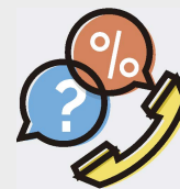
El gran aliado en customer service