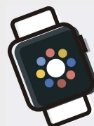
La tecnología wearable simplifica nuestra vida