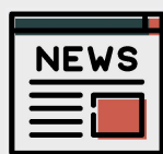
Contenido único y de alta calidad